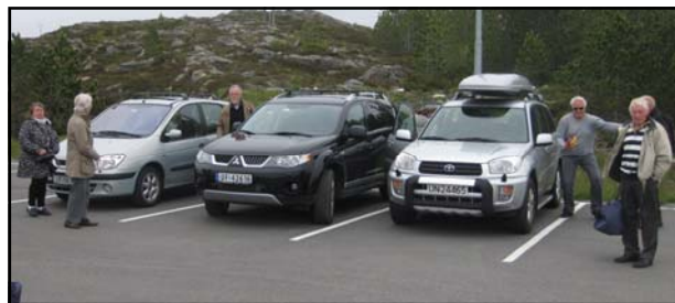
Bilene ble parkert på Averøy og vi tok bussen til Kristiansund