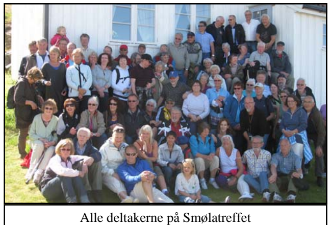
Alle deltakerne på Smølatreffet

Tiden ble brukt til å besøke alle butikkene som hadde brukt-bøker og vi var innom Isbremuseet og oppom en isbre også.