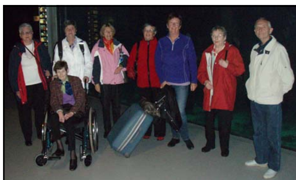
Gjengen som var på tur til Ålesund