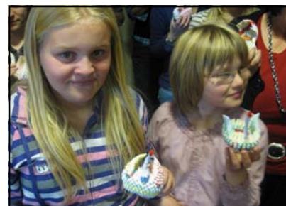
2 av våre yngre medlemmer som lærte brette origami