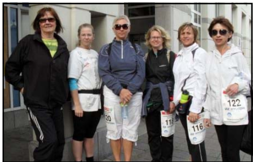
Bildet er fra Jentebølgen i 2010

SENIORGRUPPA reiser mandag 20 juni på tur til Røros. De er tilbake i Ålesund onsdag 22. juni. Vi skal bruke biler. Det leies inn en 9 seter og blir det flere som vil med, bruker vi privatbiler.