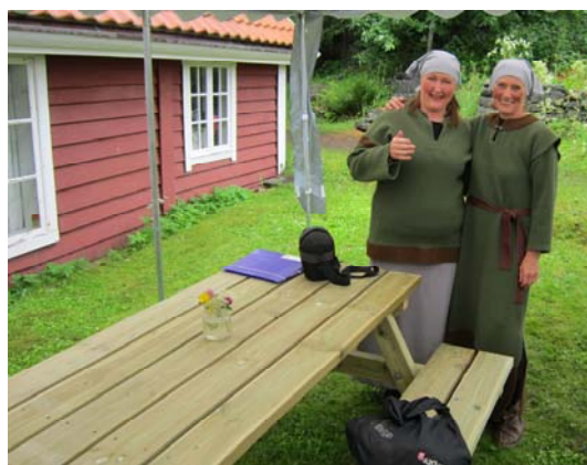
Også tolkene måtte stille i tidsriktige kostymer