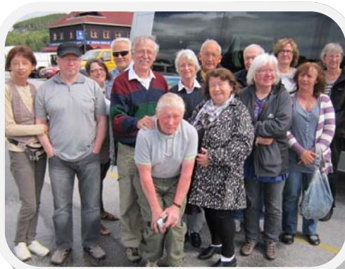
Seniorene på vei til Røros i juni