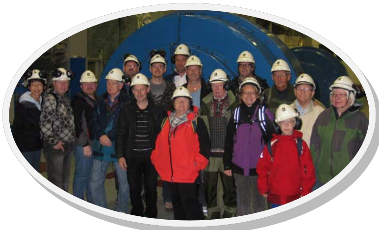
Besøk hos Tafjord Kraft i Tafjord

Det er ikke tatt ut midler av Fritidsklubben i 2011.