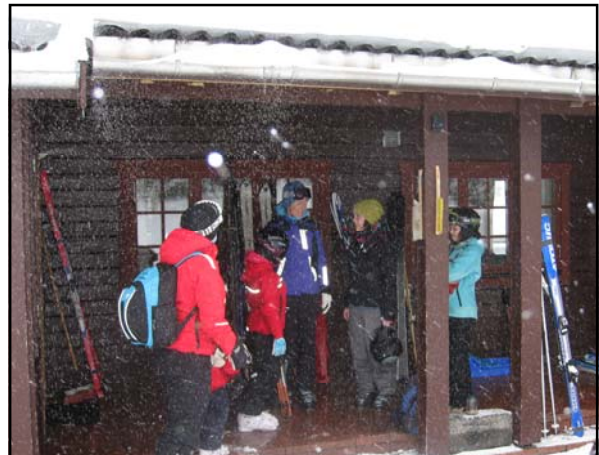
Bilder er fra Vinterhelgen i 2010.