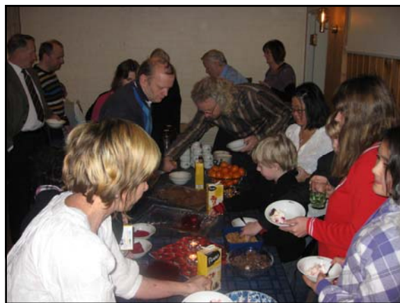
Bildene er fra festen i januar i år

Ålesund Døves Aktivitetsklubb har sitt årsmøte på Døvesenteret fredag 18. februar.