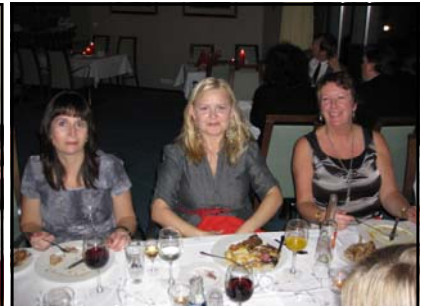
Lørdag kveld var det julebord

DØVESENTERET har fått nye møbler. Dette er en prosess som har tatt noe tid. Vi har kresne medlemmer og til slutt fant vi bord og stoler alle likte. De kommer fra Vad fabrikk i Stordal.