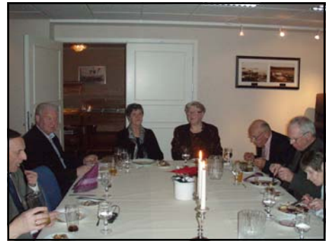
Noen av de andre som var med på festen