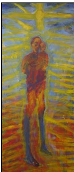
Bildet til venstre: Madonna av Franz Wiederberg. Dette er et nytt bilde i Volsda- len kirke i Ålesund, og det henger ved siden av 3 bilder fra 1974 slik at de utgjør en helhet.

Tenn lys! Nå stråler alle de fire lys for ham som elsker alt som lever, hver løve og hvert lam. Tenn lys for himmelkongen som gjeterflokken så! Nå møtes jord og himmel i barnet, lagt på strå!